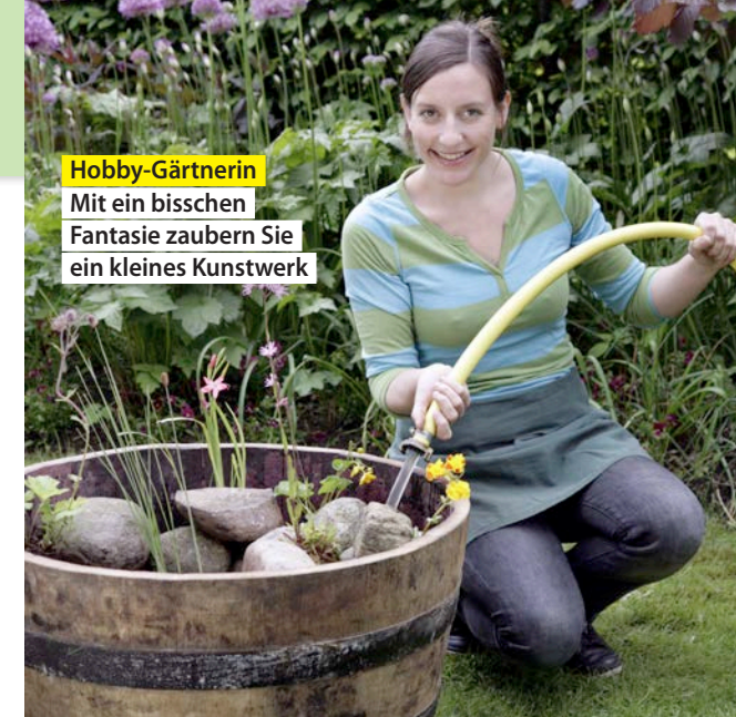
Hobby-Gärtnerin Mit ein bisschen Fantasie zaubern Sie ein kleines Kunstwerk